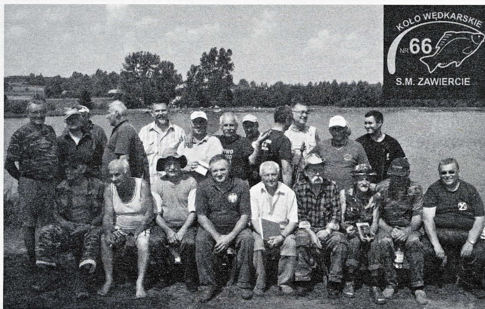
Jedną z inicjatyw wspieranych przez SM „Zawiercie” jest Koło Wędkarskie nr 66. Obecnie jego siedzibą jest pomieszczenie spółdzielni.

► Zarząd Spółdzielni Mieszkaniowej „Zawiercie” widzi potrzeby nie tylko mieszkańców swoich zasobów, lecz również mieszkańców miasta. Szczególnie dużym utrudnieniem jest brak miejsc do parkowania samochodów, których ciągle przybywa, a osiedla nie są z gumy. Służby Spółdzielni opracowały koncepcje modernizacji terenów i dróg dojazdowych. Koncepcje dotyczące terenów osiedla Centrum, Piłsudskiego i Zuzanka przekazano władzom miasta i powiatu. Zrealizowanie tych wspólnych pomysłów spowoduje powstanie nowych miejsc postojowych i częściowo rozładuje ciasnotę panującą na osiedlach naszego miasta. Pragniemy, aby nasze osiedla, a co za tym idzie nasze miasto, wyglądały coraz ładniej, a mieszkańcom żyło się coraz lepiej i bezpieczniej. //