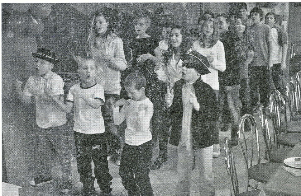
Na zdjęciach zajęcia dla dzieci w klubach osiedlowych SM „Zawiercie”.